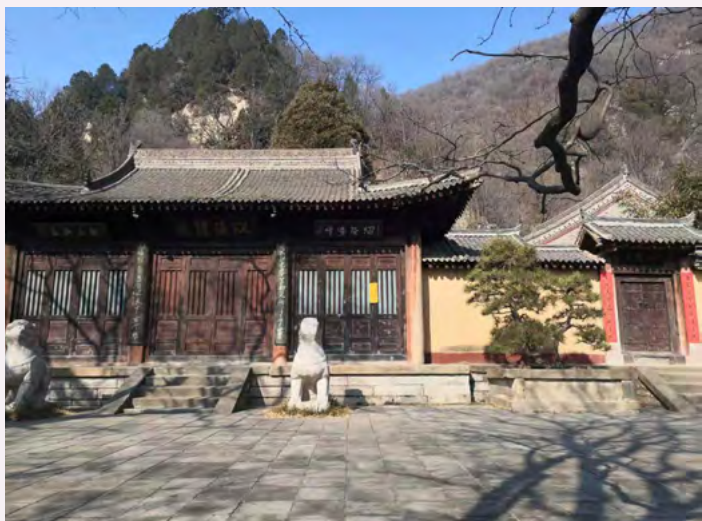
西安 净业寺

位于奈良西之京的唐招提寺是一座律宗名刹，作为东渡日本的唐朝名僧鉴真大师（688—763年）所创建之寺而名闻天下。鉴真大师出生于中国扬州，20—26岁间前往当时唐京城长安（现陕西省西安市）的实际寺和净业寺修行。可以说年轻时在长安的修行经历，令大师在建筑、雕刻艺术、医学、书法等诸多领域都汲取了当时唐朝最先进的文化精髓。