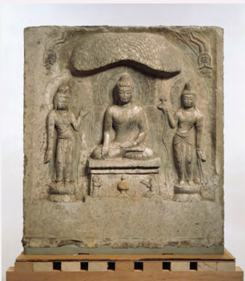
三尊佛龕

奈良国立博物馆一年一度举办的“正仓院展”非常受欢迎。“正仓院展”是对公众开放的特展，其展品是从正仓院宝物中甄选的数十件宝物。正仓院展始于1946年，此后每年都会迎来至少13万人次的参观者。在2019年正仓院展览期间，累计参观人数突破了一千万人次。正仓院展已成为奈良国立博物馆的金牌展览会，不仅在日本家喻户晓，而且随着最近其在中国知名度的不断提高，被越来越多的中国人所了解。