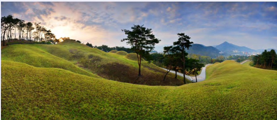
公州 宋山里古坟群

忠清南道不仅拥有众多的历史遗迹，而且还拥有海内外首屈一指的制造业龙头企业。道内制造业和高科技产业发达，农业、渔业及畜牧业也蓬勃发展，高丽参、草莓、海苔、韩国牛肉等特产负有盛名。