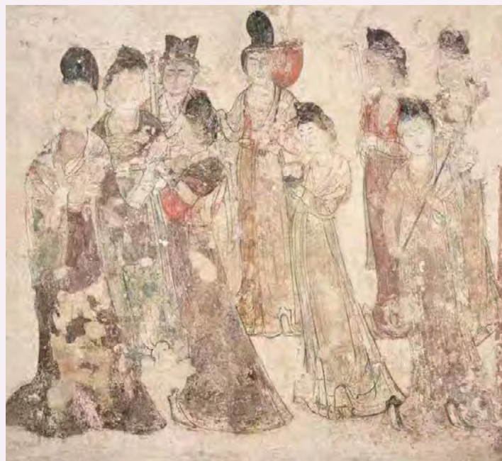
永泰公主墓宫女图（乾陵博物馆）

作为古都长安所在地的陕西省也发现不少古代陵墓。1960—1962年间发掘出土的永泰公主墓（乾陵博物馆）就是其中之一，墓中发现的“宫女图”与日本高松冢古坟西壁发现的“西壁女子群像”，在构图、所持物上具有极高的相似度。由此，我们仿佛可以感受到流淌在大唐与日本间的昔日文化交流之气息。