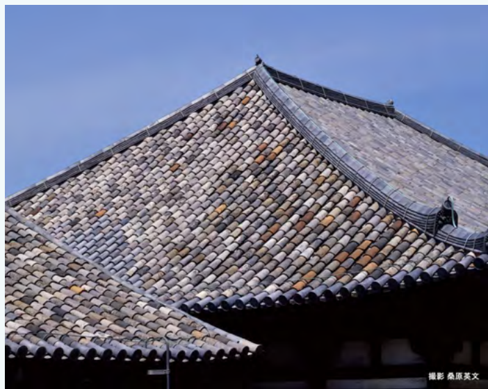
极乐堂及禅室的屋顶

据《日本书纪》记载，古时，百济派僧侣、寺庙工人、露基博士（造佛塔的技工）、瓦博士（造瓦技工）、绘画师等能工巧匠在现今奈良县明日香村地区建造了日本第一座寺院—飞鸟寺。日本第一块瓦片就是瓦博士烧制出来的，随着寺院的搬迁，瓦片也被带到了元兴寺现址。如今，历经千年的数千瓦片依旧安然无恙地铺在主殿极乐堂及禅室的屋顶上。