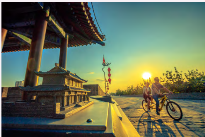
陕西省 西安市古城墙

平城京和长安城虽有许多相似之处，但亦有区别，其中最大的区别在于城墙的有无。长安城建有古城墙，而平城京没有古城墙。长安城的部分古城墙保留至今，与其他朝代的古城墙一起，形成了全长（按中心线丈量）约 13.7 公里、高达约 12 米、宽约 12-14 米的雄伟古城墙。如今这里游客如织，同时也是西安市民的休闲胜地。