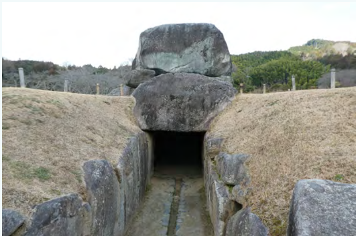
石舞台古坟石室入口

石舞台古坟石室长 7.7 米，宽约 3.5 米，高 4.7 米，岩石总重量约 2300 吨。由此可见，当时的土木及搬运技术已达到相当高的水准。由于覆盖古坟基部的土壤流失，现在巨大的两袖型横穴式石室裸露于外，这恰是石舞台古坟的显著特征。据专家推测，古墓原来应为方型或上圆下方型。