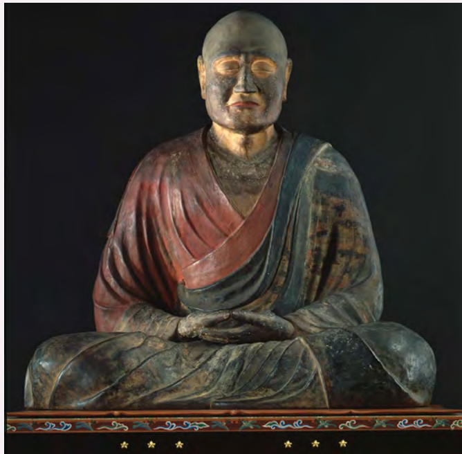
国宝 鉴真大师坐像

对日本文化作出重大贡献的鉴真大师在中国也被尊崇为伟人。有不少中国游客安排奈良唐招提寺之旅，就是为了表达自己对大师的仰慕之情。每年大师忌日前后（6月5—7日）举办的“鉴真大师坐像特殊开放日”活动中，都会有很多人瞻仰朝拜。鉴真大师至今仍为中日两国人民所尊敬和爱戴，他永远活在人们心中。