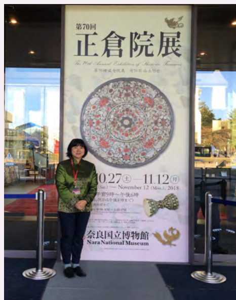
作者摄于义务讲解日

一千多年前，长安与奈良通过丝绸之路结下了不解之缘，希望今后双方能继续守护并传承古代延续至今的深情厚谊，将友好交流的接力棒传递给千秋万代并进一步深化交流。祝愿中日友谊地久天长。