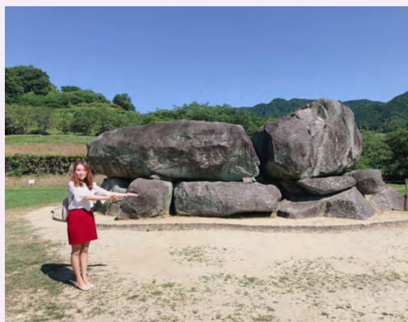
作者于明日香村石舞台古坟旁

请读者们想像着古代奈良风貌及祖先的生活情景，来参观奈良与韩国古代交流的名胜古迹吧。