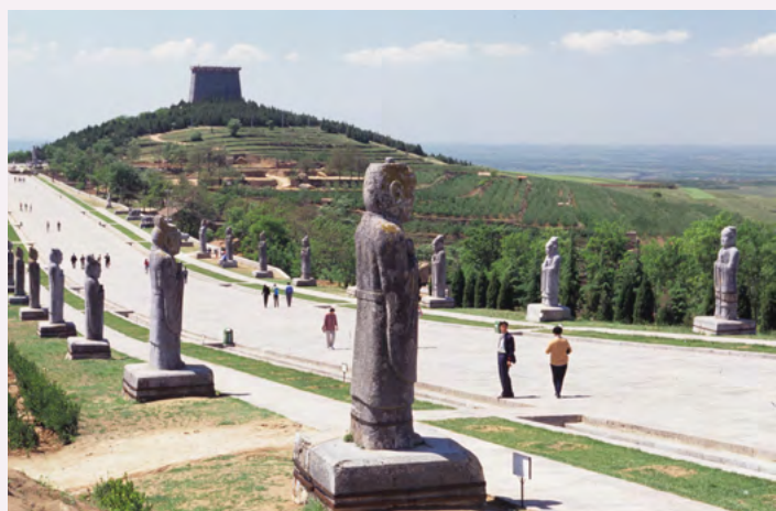
陕西省乾陵（外观）

尤其是高松冢古坟壁画的发现，作为日本首次出土的彩色古坟壁画而轰动一时。随着这一重大发现，很多人开始对古代史感兴趣，日本邮局甚至为此发行了“西壁女子群像”等纪念邮票。