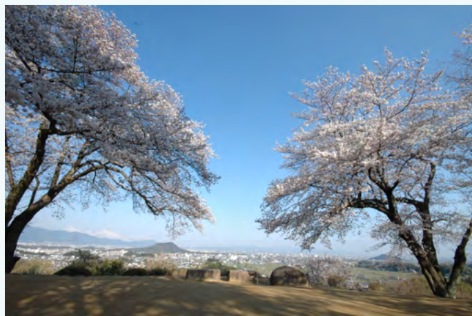
从甘櫿丘观景台远眺的风景

欢迎大家来到甘櫿丘观景台，您既可以一览飞鸟地区的秀美风光，又可以凭栏怀吊昔日飞鸟人的风采。