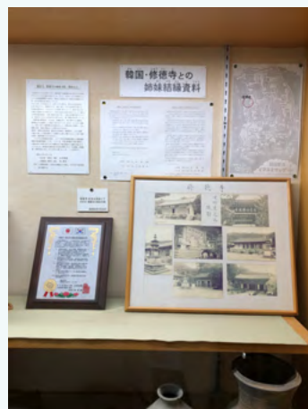
与修德寺结缘的相关资料

1987年，日本奈良县飞鸟寺与韩国忠清南道礼山郡的修德寺结缘成为姊妹寺院。在飞鸟寺，游人可以看到此寺与修德寺结缘的文字及照片等资料，还可以看到韩语版的般若心经等。