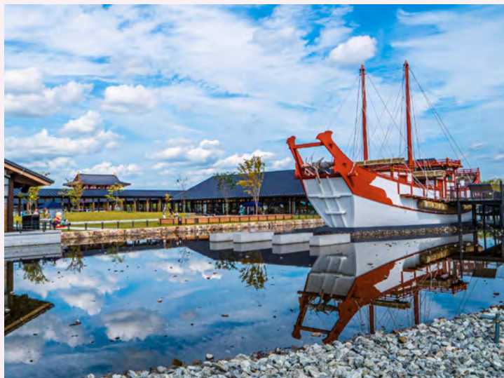
复原后的遣唐使船

模仿古代派往唐朝的“遣唐使船”而制成的同比例大小“复原遣唐使船”，现巍然坐落于平城宫遗址历史公园的朱雀门广场上。