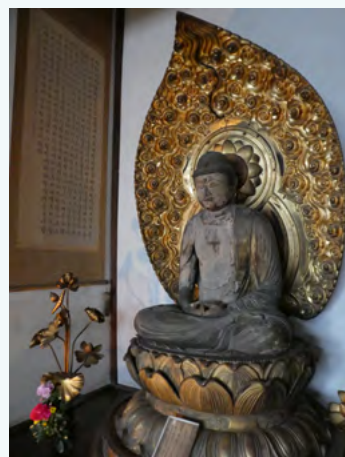
韩语版的般若心经

我看到飞鸟寺中传承了很多与古代密切相关的物件，深受感动。希望今后韩国与奈良间的交流也能像这样继续开展下去。欢迎大家参观飞鸟寺。