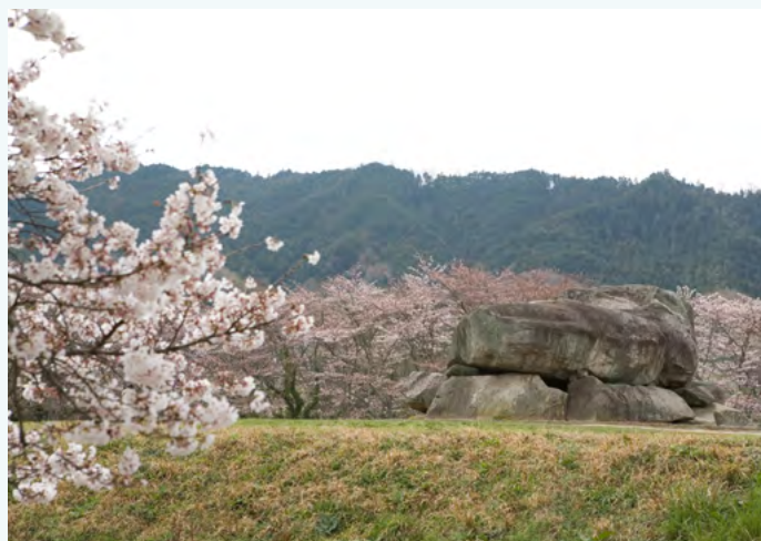
春天的石舞台古坟

在这里，您可以尽享春夏秋冬的不同风景。尤其是春季，四周一片樱花烂漫，非常漂亮。石舞台古坟拥有不同的四季风情，欢迎您前往参观游览，并尽情地感受古代飞鸟时代（592-710 年）的历史气息。