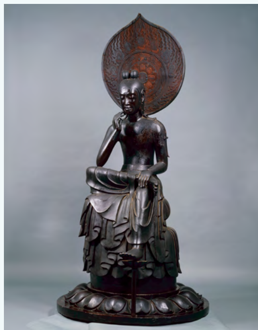
木造菩萨半跏像（国宝）

我们可以通过古代传承的佛教建筑及佛教雕刻作品，看到日韩交流的渊源流长。欢迎大家前往参观法隆寺及中宫寺等斑鸠古寺。