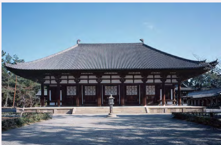
唐招提寺 金堂

鉴真大师排除万难才成功东渡扶桑。大师东渡的随行人员中，既有优秀的佛教高僧，也有一流的艺术家和工匠们，且随船携带了很多中药材和工艺品。唐招提寺的创建也深深汲取并反映了大师的思想精髓，从伽蓝布局、建筑工艺到建筑材料（例如三彩瓦），所见之处均充分体现出唐风唐韵。唐招提寺南大门的匾额上所刻“唐招提寺”四个大字，是使用的当时日本尚十分罕见的行书体，从中我们亦能感受到初唐流行书法对日本的影响。