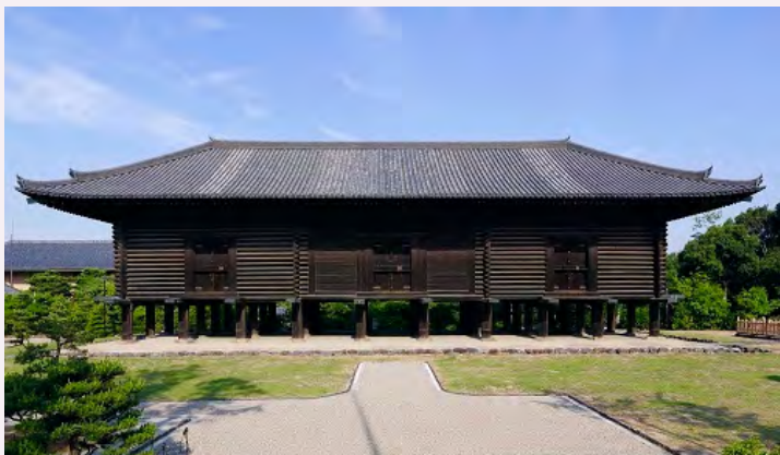
正仓院正仓（外观）

正仓院位于奈良市东大寺大佛殿附近，是一座大型高床式仓库，建筑式样为校仓造。在奈良时代（8世纪）及平安时代（8世纪末—12世纪末），政府官厅及大型寺院里都会配备保藏谷物及财产的仓库，这被称为“正仓”。但随着岁月的流逝，现在几乎所有的正仓都销声匿迹了，唯有东大寺的正仓尚保存完好，如今被称为“正仓院”的就是特指这里。