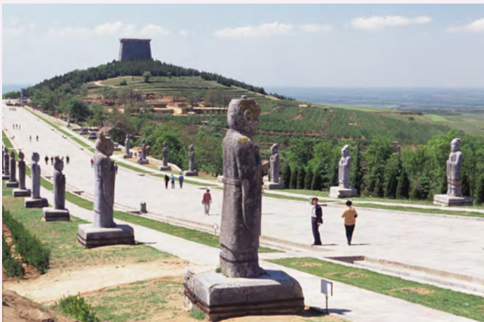
산시성 건릉(외관)

이 발견을 계기로 고대사에 흥미를 느끼는 사람이 급증하였고, 서쪽 벽에 그려진 '여자 군상' 등의 기념 우표가 발매되었을 정도였습니다.