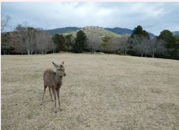
뒤쪽 밝은 부분이 미카사야마 산

나라현 내에는 ‘미카사야마(三笠山)’와 ‘미카사야마(御蓋山)’ 두 개의 ‘미카사야마’ 산이 있는데, 아베노 나카마로가 읊은 시에 등장하는 것은 ‘미카사야마(御蓋山)’로 알려져 있습니다. 옛날 건당사는 당나라로 건너가기 전에 미카사야마 산을 향해 안전한 항해길이 되기를 기도하였습니다. 가스가타이샤 신사 창건 신화의 무대이기도 한 미카사야마 산은 현재 내부 출입이 금지되어 있습니다.