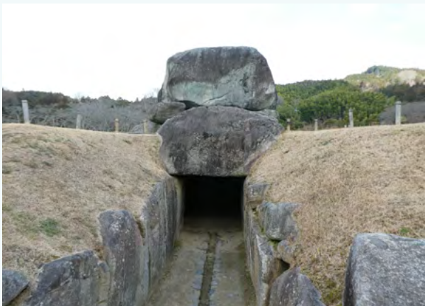
이시부타이 고분 석실 입구

이시부타이 고분은 널방의 길이 7.7m, 폭이 약 3.5m, 높이 4.7m, 바위의 총 중량이 약 2,300t으로, 그 크기에서 축조 당시의 훌륭한 토목 기술과 운반 기술을 알 수 있습니다. 또한, 봉분의 성토가 유실되어 거대한 양수식의 횡혈식 석실이 노출되어 있는 것이 특징으로, 분형은 방분 또는 상원하방분으로 추측하고 있습니다.