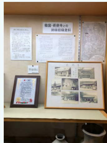
수덕사 자매결연 관련 자료

현재 아스카데라 절은 1987년부터 한국 충청남도 예산군의 수덕사와 결연하여 자매 사원의 관계를 맺고 있습니다. 아스카데라 절에서는 수덕사와의 자매결연에 관한 자료와 교류 사진, 한국어로 쓰여 있는 반야심경 등도 볼 수 있습니다.