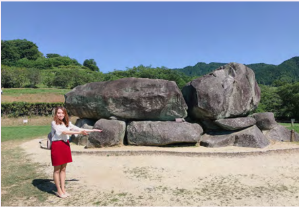
아스카무라 이시부타이 고분에서

이번에 '나노라'의 취재를 통해 서적이거나 사진으로만 봐왔던 한국과 나라의 관련 깊은 지역을 실제로 둘러보며 자세한 이야기를 듣고 견학하는 소중한 기회가 되었습니다. 이 정보지를 보시는 여러분도 꼭 한국과 나라현의 인연이 깊은 지역을 방문하셔서 고대 나라의 모습과 선인의 생활 등을 상상하며 둘러보시기 바랍니다.