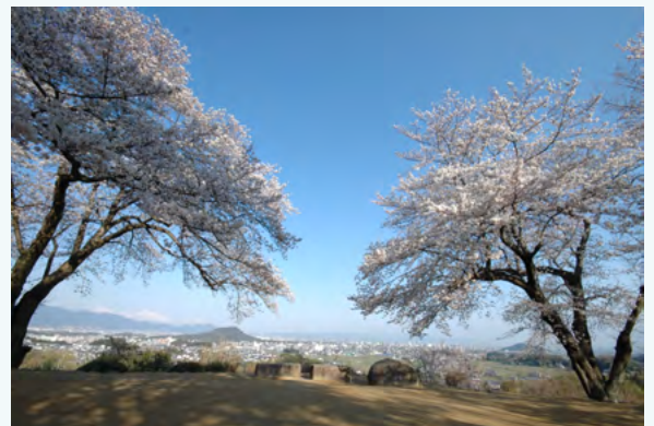
아마카시노오카 언덕에서 바라본 풍경

고대인들이 이 언덕에 올라 아스카의 풍경을 바라보며 읊은 다수의 시가 만엽집에 남아 있으며, 지금도 만엽집에 나오는 벚꽃과 자두꽃 등의 만엽식물이 심어져 있습니다. 여러분도 아마카시노오카 언덕에 올라 아스카의 경치를 바라보며 옛날 아스카인이 된 기분을 느껴보세요.