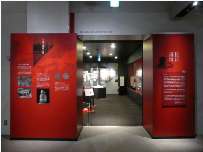
'되살아나는 아스카의 공방 -한일 기술 교류를 더듬어 보다-' 전시실 모습

A1. 1 년에 1~2 회, 봄과 가을에 특별전을 개최합니다. 다카마쓰즈카 고분이나 아스카의 석조물 등 대표적인 주제에 더해, 아스카의 고사진과 고지도 등 다양한 방면에서 아스카를 소개해 왔습니다.