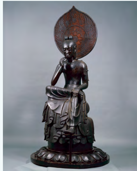
국보 목조보살반가상

※1 본당에 안치된 것은 복제품으로, 실물은 나라국립박물관에 기탁하고 있습니다.