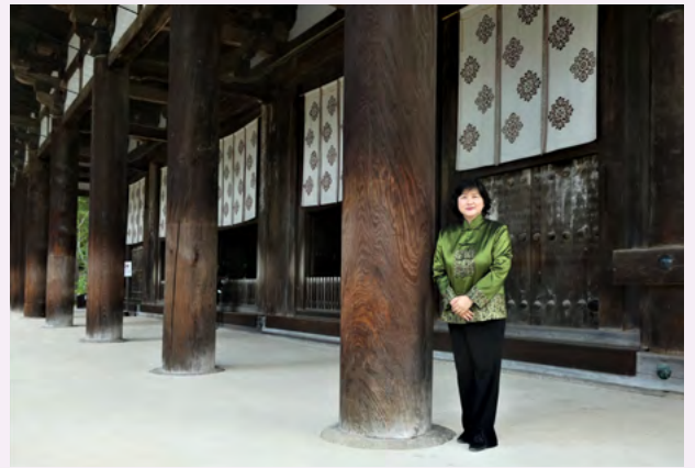
도쇼다이지 절 금당 기둥 옆에서

나라에는 도쇼다이지 절과 같이 당나라의 수도 장안의 분위기를 느낄 수 있는 중국과 관련 있는 곳이 많이 있습니다. 그중 하나인 미카사야마 산을 바라보며 작년 중추절에 제가 읊은 시를 한 수 소개합니다. "중추절 밤, 미카사를 바라보며 월병을 먹고 있자니, 나카마로가 야마토를 그리워했듯 나도 장안이 그리워지는구나."