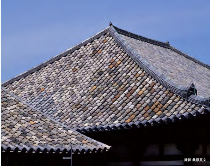
극락당과 선실의 지붕

일본서기에는 아스카데라 절 건립에 백제에서 승려와 사공 (절 건축 기술자), 노반박사, 와박사, 화공 등의 기술자를 파견하였다고 기록되어 있습니다. 그때 와박사가 만든 일본 최초의 기와가 절이 이곳으로 신축 이전했을 때 함께 옮겨져, 지금까지도 극락당 (본당) 과 선실의 지붕에 수천 장 남아 있습니다.