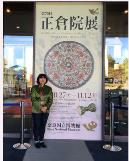
자원봉사활동 당시의 필자

장안과 나라의 실크로드를 연결하는 인연과 같이 앞으로도 고대부터 이어져 온 교류를 차세대에 이어주고 싶다는 생각이 들었습니다.