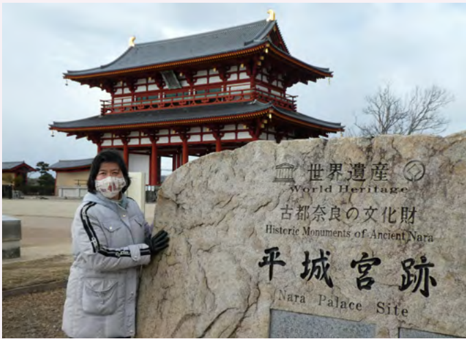
주작문 앞에 선 필자

장안성과 비슷한 점으로는 ①궁전의 위치, ②정원을 만드는 궁전 건설의 사상, ③기능별 건축물의 배치, ④당삼채 기술을 도입한 녹유기와 사용 등 중국의 영향을 많이 받은 흔적이 남아있는 곳이라고 할 수 있습니다.