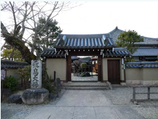
아스카데라 절 입구(정면)

아스카데라 절의 본존인 동조석가여래좌상(아스카 대불)은 7세기 초기에 도래계인 구라쓰쿠리노 도리(鞍作止利)가 제작한 일본에서 가장 오래된 불상입니다.