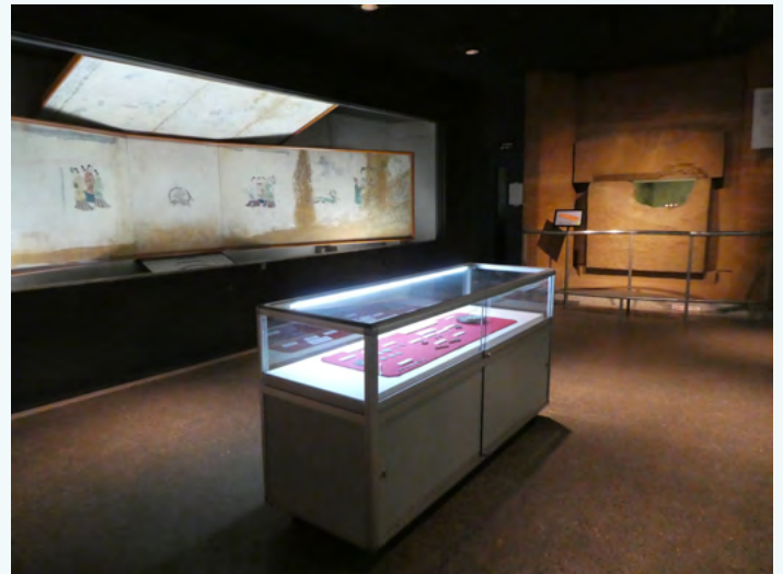
다카마쓰즈카 벽화관 내부(전시 모습)

현재, 벽화는 1년에 몇 차례만 공개하고 있으나, 고분 가까이 있는 '다카마쓰즈카 벽화관'에서 발견 당시의 벽화를 충실히 재현한 현상 모사를 볼 수 있습니다. 또한, 재현 벽화 뿐만 아니라 석곽의 모형과 부장품의 모조품 등을 전시하고 있어, 다카마쓰즈카 고분을 더욱 자세히 알 수 있습니다.