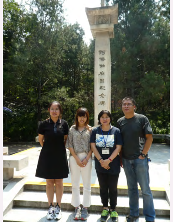
2019년도 차세대 양성사업 때 방문한 아베노 나카마로 기념비 앞에서 기념 사진

나라현에서는 산시성과 우호 교류의 일환으로 국제 교류 등에 관심이 있는 나라현 청년이 산시성을 방문하는 ‘우호 교류를 이끌어 갈 차세대 양성 사업’을 실시하고 있으며, 매번 호스트 패밀리와 함께 아베노 나카마로 기념비를 방문하고 있습니다.