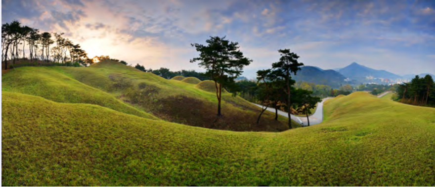
공주 송산리 고분군

이처럼 충청남도는 역사적 유산이 다수 남아있을 뿐만 아니라, 국내외 굴지의 제조회사가 도내에 위치하여 제조업과 하이테크 산업이 발달했습니다. 또한, 농어업 및 축산업도 활발하며, 주요 특산품으로는 인삼, 딸기, 김, 한우 등이 있습니다.