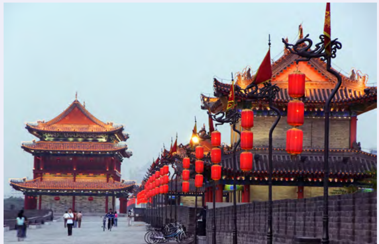
산시성 시안시 고성벽