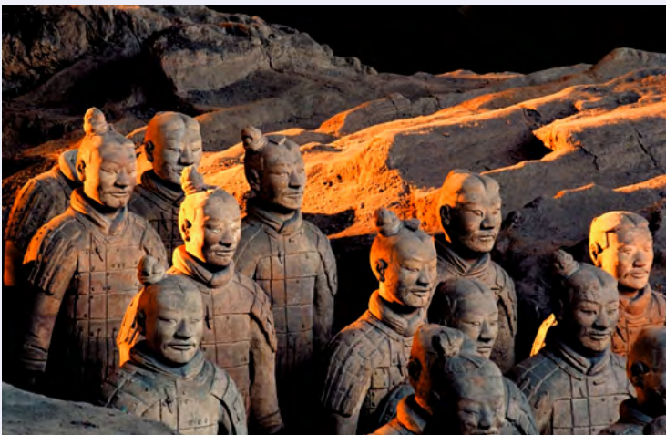
산시성 진시황릉과 병마용갱

현대에도 지난날의 역사와 문화가 공존하며 발전해 온 점이 나라현과의 공통점 중 하나가 아닐까요.