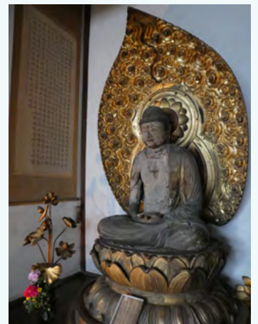
한국어로 쓰여 있는 반야심경

아스카데라 절에는 오랜 옛날부터 한국과의 인연을 느낄 수 있는 것들이 많이 남아있어 매우 감동했습니다. 그리고 앞으로도 한국과 나라의 교류가 계속 이어졌으면 하는 생각이 들었습니다. 여러분도 꼭 아스카데라 절에 가보시기 바랍니다.