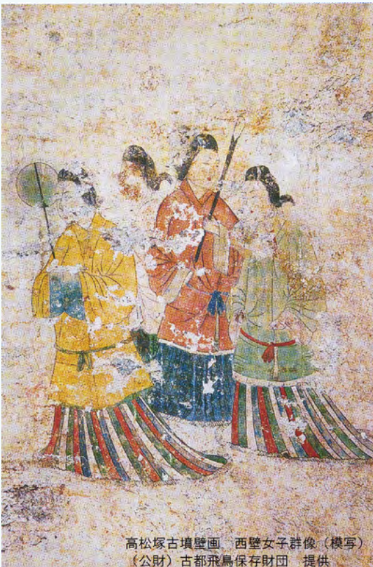
高松塚古墳壁画 西壁女子群像(模写)

벽화는 석실의 동쪽, 서쪽, 북쪽 벽과 천장의 네 면에 존재하며, 마름돌에 수mm 두께로 회칠을 한 위에 그려져 있습니다. 동쪽 벽에는 사신 중 하나인 청룡, 해, 남자 군상, 여자 군상이 그려져 있으며, 서쪽 벽에는 사신 중 하나인 백호, 달, 남자 군상, 여자 군상이 그려져 있습니다.