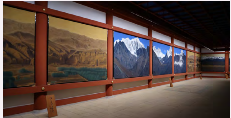
대당서역벽화(히라야마 이쿠오 작품)

대당서역벽화전에는 히라야마 이쿠오 화백이 약 20년에 걸쳐 약 4,000장의 밑그림을 바탕으로 제작한 '대당서역벽화' 의 세계가 펼쳐져 있으며, 그곳에는 7장면 13벽면, 전장 49m의 벽면에 현장삼장의 여행의 출발지인 장안에서 목적지인 날란다까지의 풍경이 그려져 있습니다.