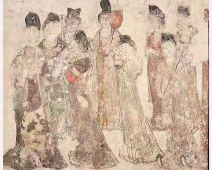
영태공주묘 궁녀도(건릉박물관) (사진 제공 : 산시성 인민대외우호협회)

한편, 중국의 고도 장안이 있던 산시성에도 고분이 많이 있습니다. 그중 1960년부터 1962년에 발굴된 영태공주묘에 그려진 '궁녀도'는 다카마쓰즈카 고분 서쪽 벽에 그려진 '여자 군상'과 구도와 소지품이 비슷하여 당시 당나라와 일본 간의 문화적 교류가 있었음을 짐작할 수 있습니다.