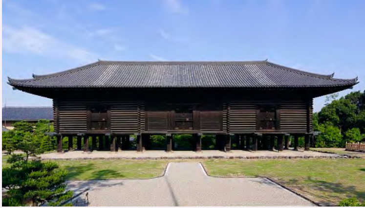
정창원 정창 외관

정창원(쇼소인)은 나라시의 동대사 대불전 가까이에 위치한 교창 구조의 대규모 고상식(高床式) 창고입니다. 나라 시대와 헤이안 시대의 관청과 대사원에는 정창(正倉)이라 불리는 곡물과 재물을 보관하는 창고가 있었습니다. 그러나 대부분이 세월이 경과 함에 따라 사라져, 현존하는 동대사 절의 정창이 '정창원'이라 불리게 되었습니다.