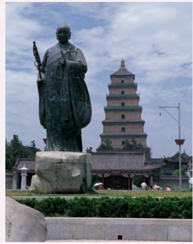
대안탑 옆 현장삼장 동상

그 외에도 현장삼장을 느낄 수 있는 장소가 있으며, 그중 하나로 현장탑 북쪽에 있는 '대당서역벽화전' 을 들 수 있습니다.