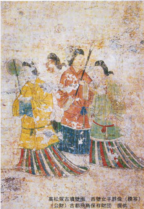
高松塚古墳壁画 西壁女子群像(模写)

※1 다카마쓰즈카 고분의 주작은 도굴 시 파괴되어 확인되지 않고 있습니다.