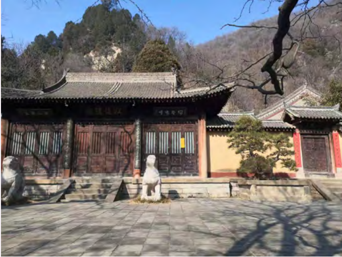
시안 정업사

도쇼다이지 절은 나라시 니시노쿄에 있는 율종의 이름난 사찰로, 당나라 시대에 도래한 감진화상(688~763년)이 창건한 사찰로 널리 알려져 있습니다. 감진화상은 중국 양주(揚州) 출신으로 20~26세쯤 당나라 수도인 장안(현재 산시성 시안시)의 실제사(實際寺)와 정업사(淨業寺)에서 수행 등을 통하여 건축, 조각, 의약학, 서예 등 다양한 분야에서 당시 가장 앞서갔던 당나라 문화를 배웠다고 전해집니다.