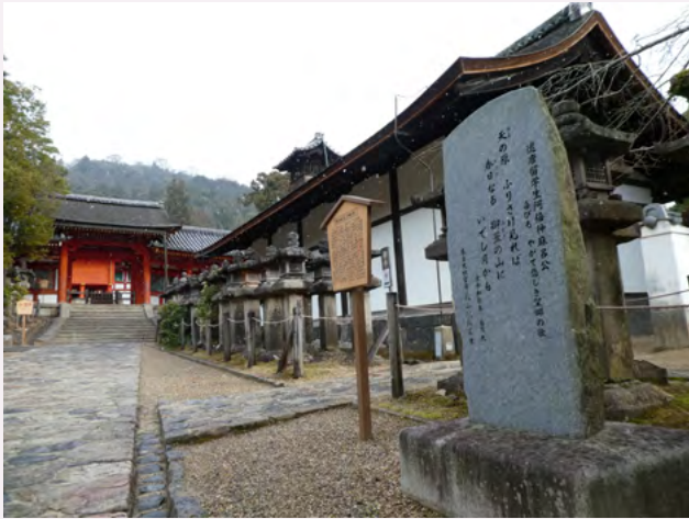
아베노 나카마로 노래비(가스가타이샤 신사)

아베노 나카마로는 건당사의 대표적인 인물로, 717년 당나라 장안(현재 산시성 시안시)에서 유학하여 당나라 관료가 되었으며, 753년에 드디어 당나라 황제에게 귀국을 명받았을 때 읊은 것이 이 시입니다. 그 후, 일본으로 돌아가려고 한 아베노 나카마로였으나, 결국 귀국하지 못한 채 당나라 땅에서 숨을 거두고 말았습니다.