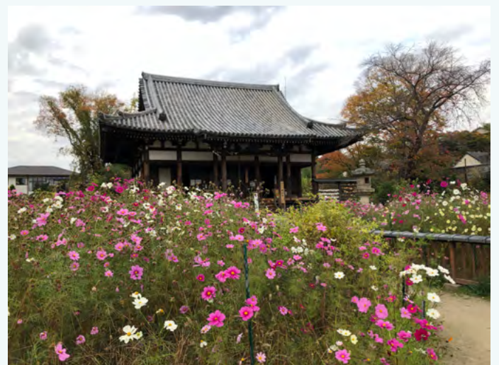
한냐지의 코스모스(2020년 11월 촬영)

여러분도 역사 깊은 절과 사계절을 물들이는 꽃을 보러 가 보시는 건 어떨지요.