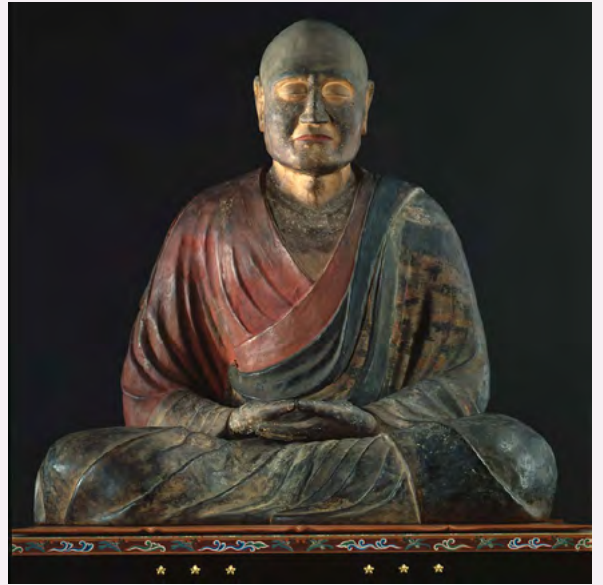
국보 감진화상 좌상

일본의 문화 발전에도 크게 기여한 감진화상은 중국에서도 매우 유명한 위인 중 한 사람으로, 감진화상에게 경의를 표하기 위해 지금도 많은 중국인 관광객이 도쇼다이지 절을 방문합니다. 또한, 감진화상의 기일에 맞추어 행해지는 감진화상 좌상 공개(매년 6월 5일~7일) 때는 많은 사람이 참배하러 오며, 오늘날에도 일본과 중국 양국에서 존경받고 있습니다.