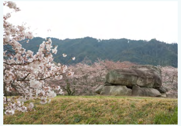
이시부타이 고분의 봄 풍경

또한, 이시부타이 고분은 계절마다 다른 경치를 즐길 수 있습니다. 특히 봄에는 주변에 벚꽃이 피어 매우 아름답습니다. 계절에 따라 다양한 분위기를 즐길 수 있는 이시부타이 고분에서 고대 아스카의 역사의 숨결을 느껴보세요.