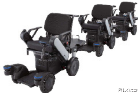
追従型ロボティックモビリティ パナソニック プロダクション エンジニアリング PiiMo