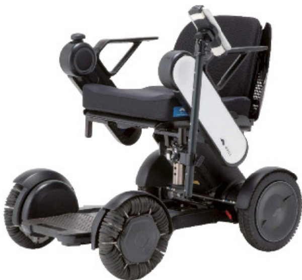
近距離モビリティ WHILL Model C

体験① 次世代モビリティを活用した自由散策、 観光・ルート案内アプリ体験【事前予約】