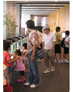
イメージ (昨年の様子)

今回は、大和高原の都祁、御杖、大字陀を舞台に、農業農村の風景と周辺の田んぼや水路にすむ生き物を展示します！