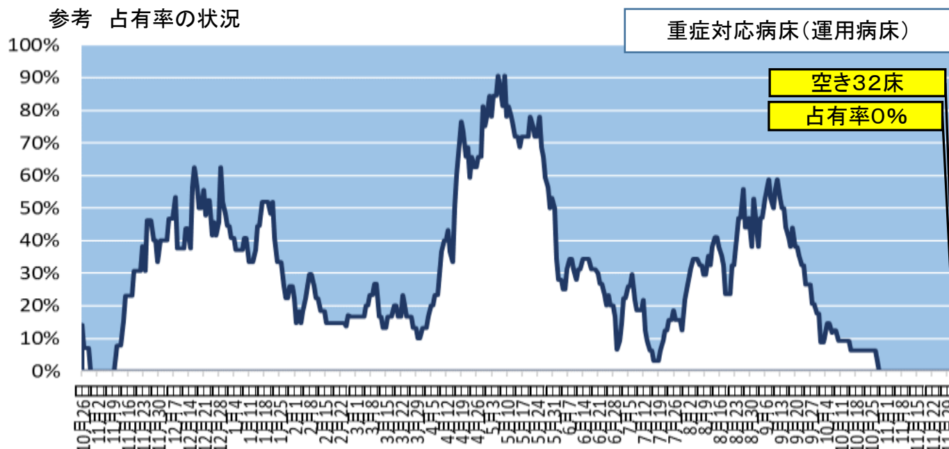
参考 占有率の状況