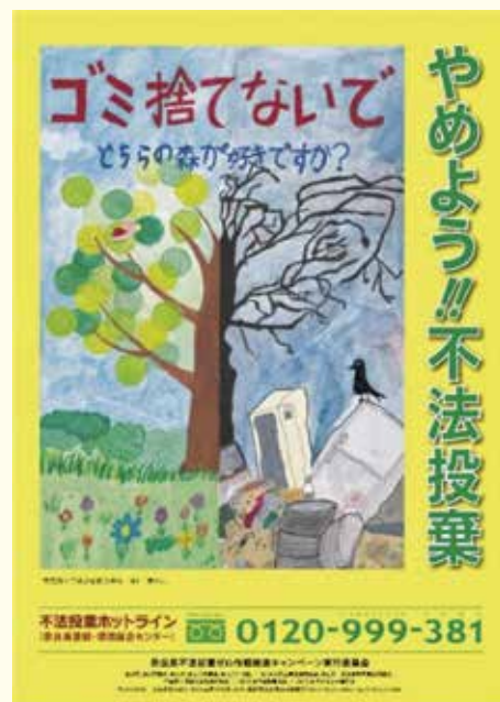
不法投棄ゼロ作戦啓発ポスター