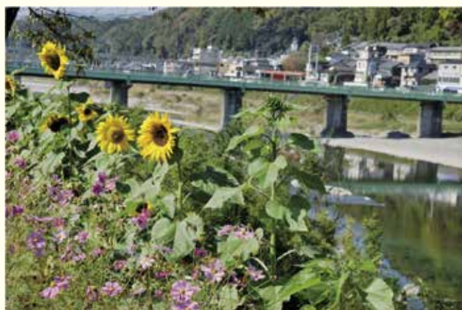
植栽によるきれいな水辺空間づくり