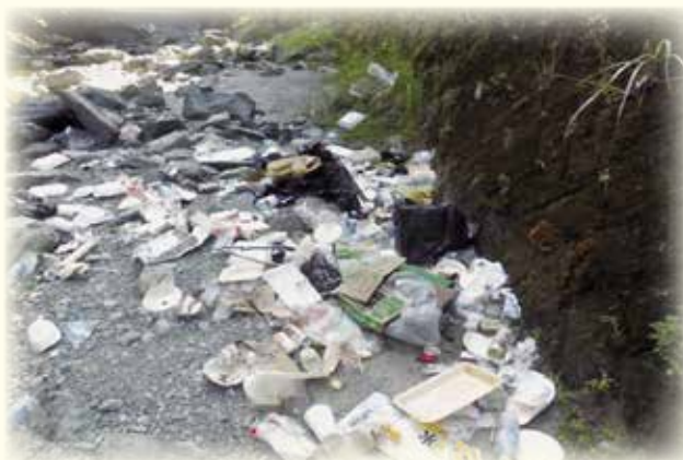
バーベキューごみの不法投棄