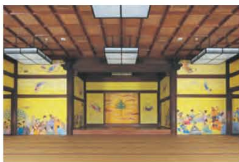
薬師寺 慈恩殿の障壁画