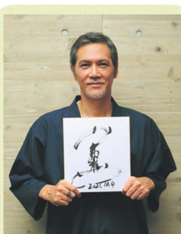
加藤 雅也さんの サイン色紙をプレゼント! (詳しくは27ページ)

出す雰囲気は、映像のクオリティを上げます。映画を見た人がその場所に思いを馳せ、そこで映画を撮りたいと思ってもらえるかもしれません。世界の映画制作会社が「奈良でおもしろい映画が撮れるじゃないか」と思ってもらえるような状況になるとうれしいですね。これからも映画などを通じて、さまざまな奈良を見てほしいと思っています。