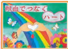
令和3年度献血運動啓発ポスター 入賞作品