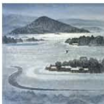
井上嶺(百成山)当館蔵 (前期のみ表示)

開催中～3/13(日) 一般600(480)円 大・高生500(400)円 中・小生300(240)円 期間中に展示替えを行います。