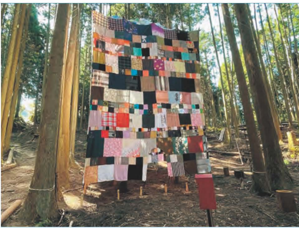
西尾美也 人間の家