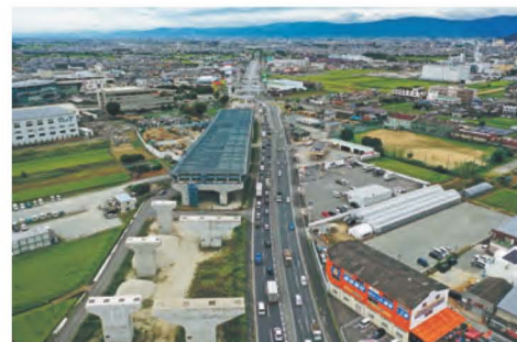
京奈和自動車道(橿原北IC~橿原高田IC)高架橋上部工事施工中(R3.9)

南海トラフ地震等大規模災害に対応するため、五條市に建設予定の2000m級滑走路を持つ大規模広域防災拠点の整備。大和平野中央部における県立大学工学系第2学部設置と国民スポーツ大会用のスポーツ施設の整備を軸としたスーパーシティ構想の実施。中央卸売市場の市場部門の全面建て替えと食を楽しみ憩える空間づくり。JR関西本線高架化と新駅設置事業、京奈和自動車道の建設推進、平城宮跡歴史公園の整備、近鉄大和西大寺駅の高架化と平城宮跡内の線路移設など、楽しみな事業が多くあります。