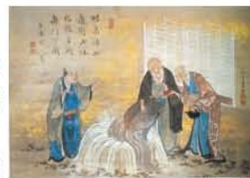
高松北斎「新羅圖」江戸時代(18世紀)