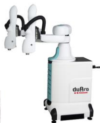
「duAro」川崎重工業製 人共存型 吸着ハンド付