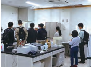
図3 研究員の説明を聞く参加者

大学生や高校生等の若い世代を対象に、研究体験を通じて、当センターの研究業務を紹介するとともに、本県の食と農への関心を高めていただく機会となりました（図3）。