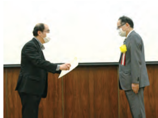
図1 全国農業関係試験研究場所長会より授与

カキ果実の渋味成分である柿タンニンの迅速な抽出方法の開発と、その利活用技術の開発が評価されました。また、県内企業による柿タンニンの量産体制の確立や、その利活用を推進するため、大学・企業と連携し抗ウイルス活性を始めとする様々な機能性の解明や産業的活用にも寄与しています。