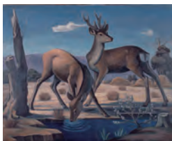
浜田稜光「水辺の鹿」 1932(昭和7)年