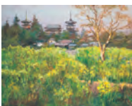
内藤定昭「春薬師寺」当館蔵(後期)