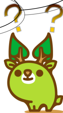
奈良県エコキャラクター 「な～らちゃん」

そんな悩みにお応えするため、県内事業所を対象に 環境の専門家をアドバイザーとして派遣します！！