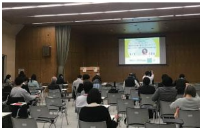
これまでの様子 (2016年3月19日、2021年3月11日開催)