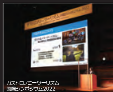
ガストロノミーツーリズム 国際シンポジウム2022