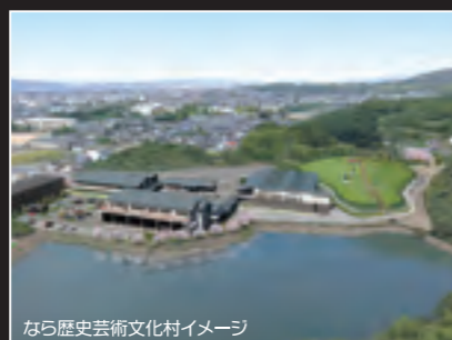
なら歴史芸術文化村イメージ