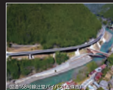
国道168号線辻堂バイパス(五條市)