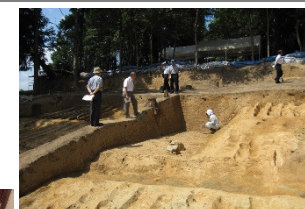
埋蔵文化財発掘調査