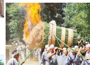
東坊城のホーランヤ