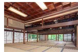
橿原神宮 旧織田屋形