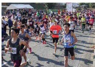
飛鳥ハーフマラソン

また「日本の心のふるさと」に相応しい良好な景観創出として、観光周遊ルートでの花づくりや稲刈り田での「はざかけ」を行い、観光来訪者に鑑賞していただくことで本地域の魅力にふれていただきました。