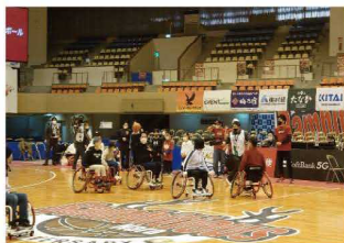
車椅子バスケットボール体験会 (奈良県)

奈良県では、車椅子バスケットボール体験会を実施。奈良市、大和郡山市、三郷町では、誰もがスポーツに親しめる環境づくりの一環としてバスケットコート等を整備。天理市、宇陀市では、バンビシヤス奈良公式戦への市民の無料招待を実施。橿原市、王寺町ではバスケットボール大会を開催しました。