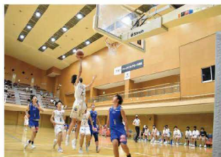
バスケットボール大会 (橿原市)