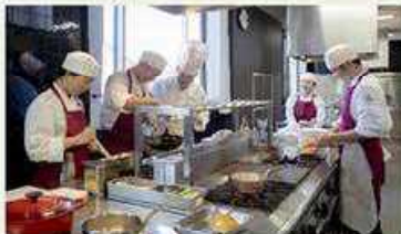
フードクリエイティブ学科調理実習

なら食と農の魅力創造国際大学校で、次世代の「食」と「農」のトップランナーの育成に取り組めます。