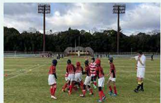
ラグビーイベント「まってる！花園」

スポーツイベント等の開催により、スポーツ活動への参加を促進します。 スポーツの推進を支える人材育成に取り組みます。