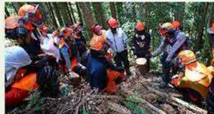
制度の担い手となるフォレスターアカデミーの学生達

森林の4機能（森林資源生産・防災・生物多様性保全・レクリエーション）を高度に発揮するため、新たな森林環境管理制度を担う人材を養成するとともに、その拠点を整備し、目指すべき森林（恒続林）に誘導を行います。