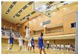
バスケットボール大会 (橿原市)