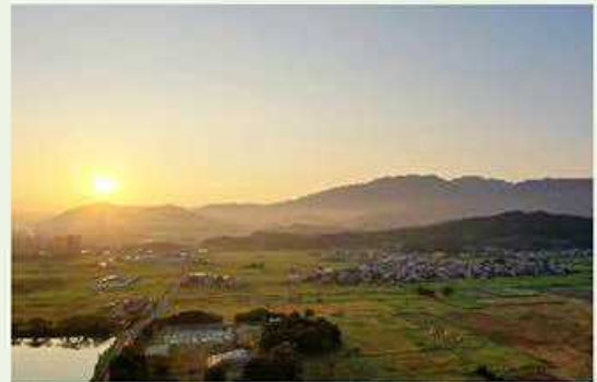
藤原宮跡と香具山

「飛鳥・藤原の宮都とその関連資産群」の世界遺産登録の推進に取り組んでいます。世界遺産登録により、構成資産の保全を行うとともに、県内への誘客を図ります。