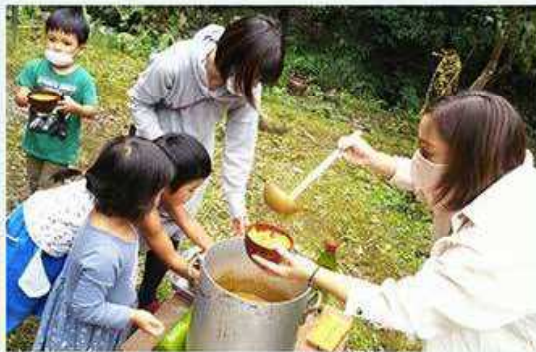
東吉野こども食堂の活動

地域の誰もが参加でき、多様な人たちが運営する「こども食堂」の活動を広め、地域での子どもの多様なはぐくみを支援します。