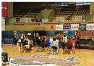
車椅子バスケットボール体験会 (奈良県)

奈良県では、車椅子バスケットボール体験会を実施。奈良市、大和郡山市、三郷町では、誰もがスポーツに親しめる環境づくりの一環としてバスケットコート等を整備。天理市、宇陀市では、パンビッシュ奈良公式戦への市民の無料招待を実施。橿原市、王寺町ではバスケットボール大会を開催しました。