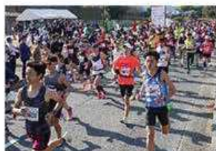
飛鳥ハーフマラソン

また「日本の心のふるさと」に相応しい良好な景観創出として、観光周遊ルートでの花づくりや稲刈り田での「はざかけ」を行い、観光来訪者に鑑賞していただくことで本地域の魅力にふれていただきました。