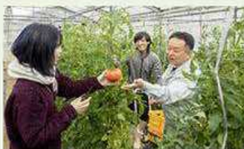
アグリマネジメント学科専門実習