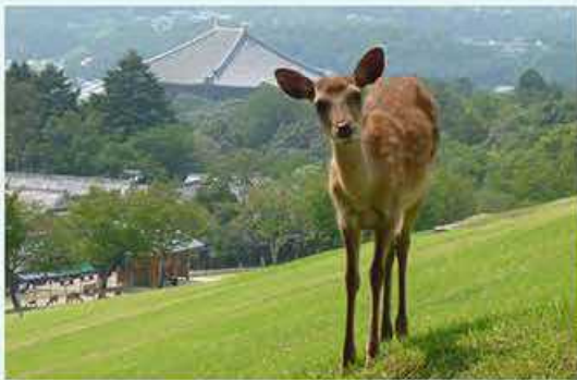
奈良公園（若草山）のシカ

奈良公園が100年先も世界に誇れる公園であり続けるために、奈良のシカの保護、春日山原始林の保全、植栽の整備などの取組を進めます。