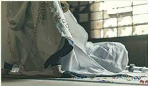
古民家でのコスプレ撮影

奈良県立大和民俗公園に移築復原した、県内各地域の特徴的な重要文化財等の民家を保存イベントや映画のロケ等に活用します。