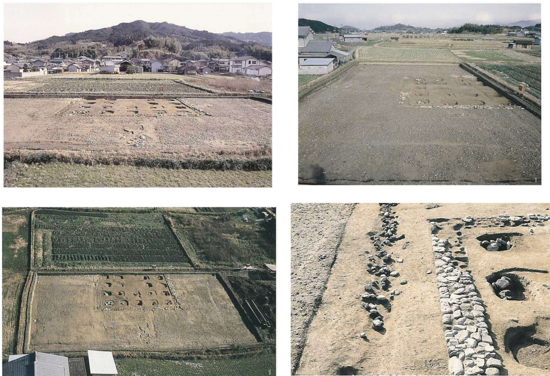
写真 2-9 内郭前殿（第73次）

1979（昭和54）年には、内郭前殿 SB7910、翌1980年には内郭南門が病院建設予定地の調査で検出され、これによって内郭の南北中心軸と、南北・東西規模が確定した。東西152～158m、南北197mを測る。こうして、飛鳥宮跡は、内郭とエビノコ郭、そしてそれを取りまく外郭で構成されることが明らかとなった。