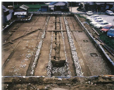
写真 2-7 エビノコ郭南辺 (第 116 次)

1977 (昭和 52) 年に内郭の東南方、現在の明日香村役場の東で実施された第 61 次調査では飛鳥宮跡の発掘調査の中で最大規模の建物 SB7701 が検出され、字エビノコに所在したことからエビノコ大殿と命名された。