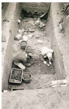
写真 2-5 外郭 (第 104 次)