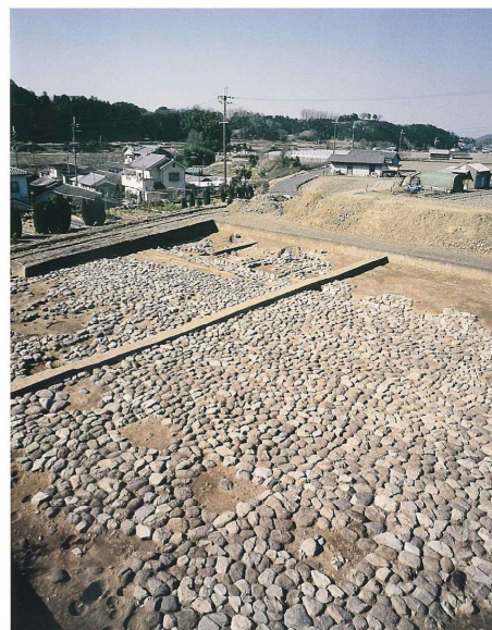
写真 2-11 正殿前の石敷き広場（第153次） (SB0301)