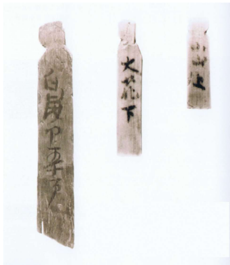
写真 2-4 「白髪部五十戸」「大花下」「小山上」木簡