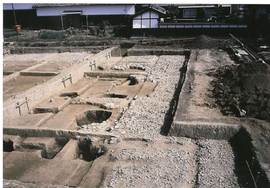
写真 2-8 エビノコ大殿 (第 61 次) (SB7701)