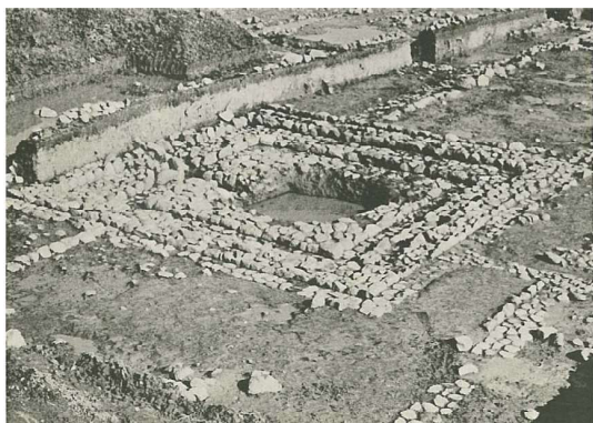
写真 2-1 井戸（SE6001）

これらの調査範囲が、1972（昭和47）年に「伝飛鳥板蓋宮跡」として国史跡に指定されることとなった。石敷・雨落ち溝・柱列などが復元・表示され、史跡公園として整備されている。さらに、内郭東辺掘立柱塀である東一本柱列 SA6101 が、南へ延びることが確認され、宮殿遺構が南に大きく広がることが判明した。これにより、吉野川分水の路線は、当初より東に変わる事となった。