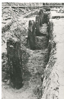
写真 2-2 内郭東一本柱列