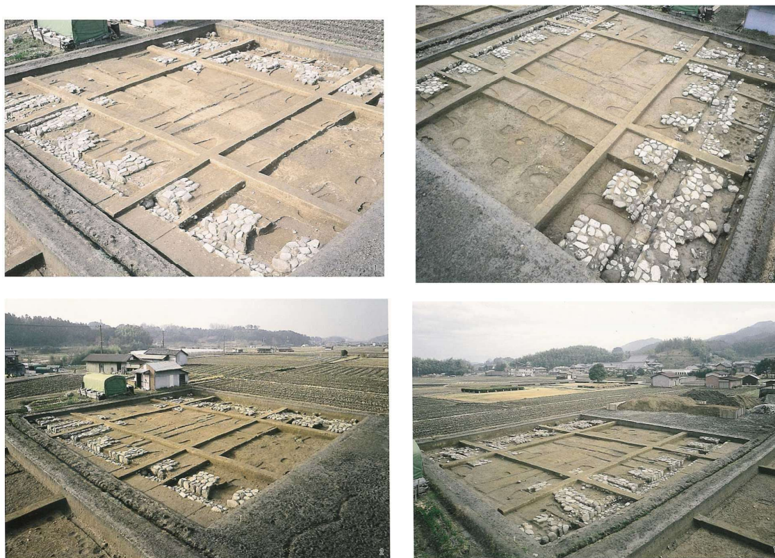
写真 2-12 北の正殿（第 155 次）（SB0501）

これら建物の性格をめぐる諸説がある。内郭全体を内裏相当区画とする説、内郭北区画を内裏相当区画であり、内郭前殿を大極殿とする説などであり、岡本宮の南に飛鳥浄御原が造営されたという記事とあわせて、議論が交わされている。