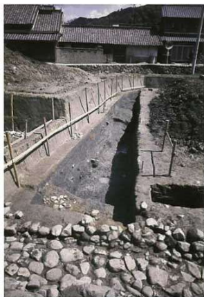
写真 2-3 外郭 (第 51 次)