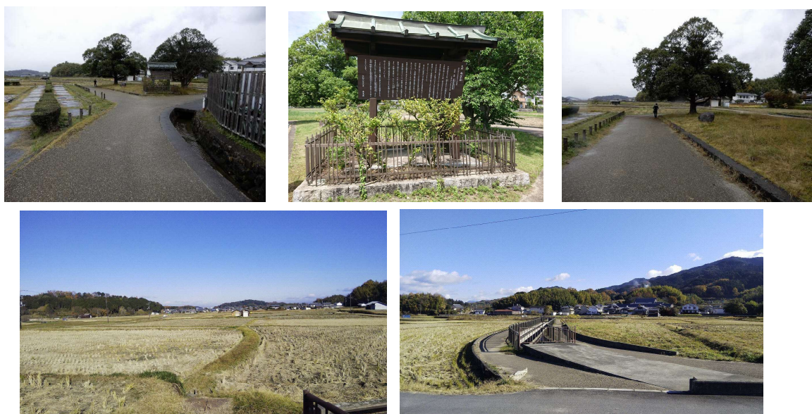
写真 8-3 内郭北方地区の様子