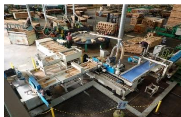
製材工場の能力強化 (県産スギ間柱製造ライン)