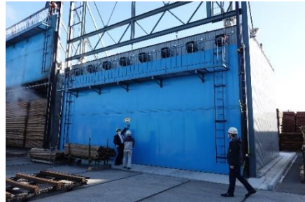
品質向上のための乾燥施設整備

○ 公共建築物等非住宅建築物の木造・木質化の推進のための 財政支援等 を充実していただきたい。