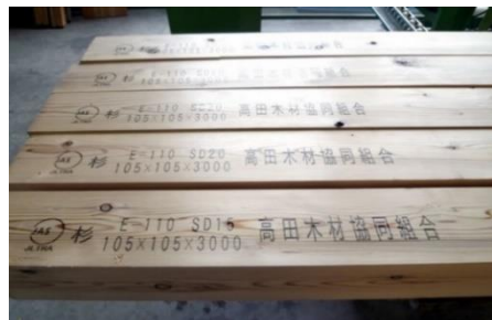
奈良県で生産されたJAS製材品