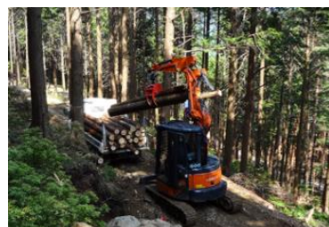
車両による集材に適した奈良型作業道