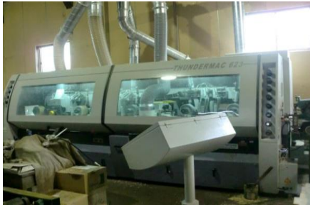
生産効率向上のための製造ライン整備