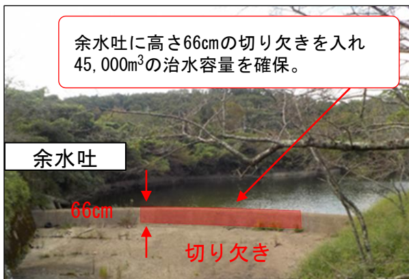
水位低下方式による治水容量確保 (高山ため池・生駒市)