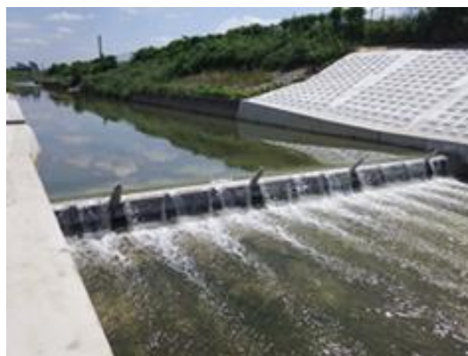
全面更新した井堰（大和高田市松塚）