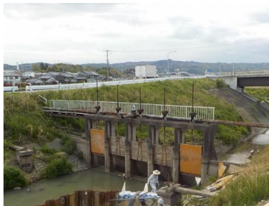
老朽化した井堰（河合町城内）