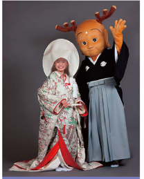
館内フォトスポットで記念写真をパチリ!