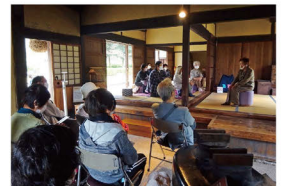
古民家活用イベント 「ようこそ!お話の世界へ」