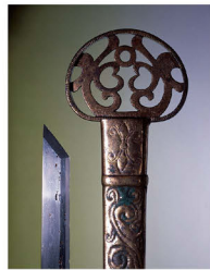
【重要文化財】 双龍環頭大刀/かわらけ谷模穴蓋 (島根県立古代出雲歴史博物館蔵)