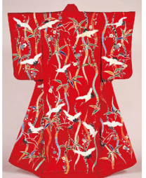
赤輪子地竹梅立涌鶴模様打掛 田中本家博物館蔵

一般 1,000円 大・高生 800円 中・小生 600円 婚礼の儀式には祈りと喜びの感情が満ちあふれています。花嫁を美しく彩る婚礼衣装やさまざまな調度品には、幸せを祈る色や形、模様が用いられました。