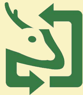
奈良県リサイクル認定製品