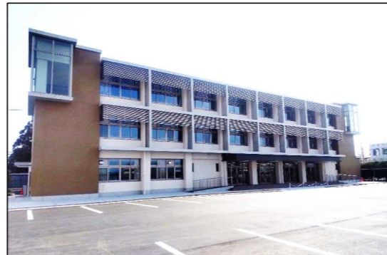
磯城野高校 R4. 3月 工事完了