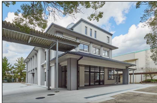
郡山高校 R4. 3月 工事完了