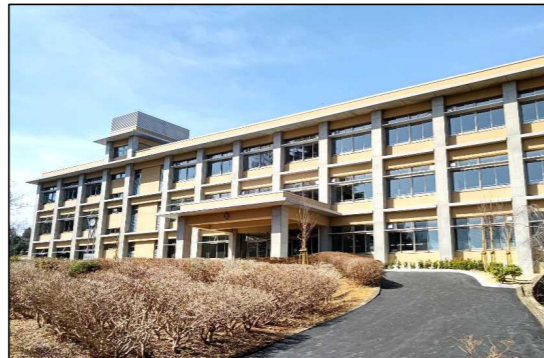
山辺高校 R4. 3月 工事完了