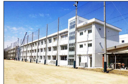
王寺工業高校 R4. 3月 工事完了