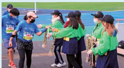
奈良マラソンでのボランティアの様子

ボランティア登録していただいた方には定期的にボランティア募集のメールを送っています。ぜひご登録ください。