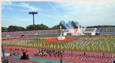
2019年いきいき茨城ゆめ国体

地元奈良県で繰り広げられる国内トップレベルの熱い戦いを皆で応援し、盛り上げていきましょう！