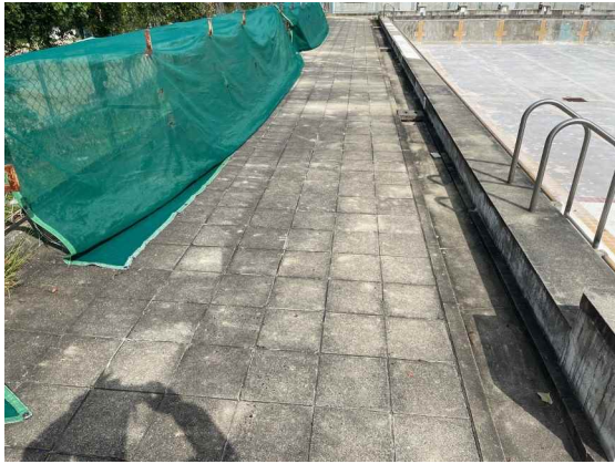
プールサイド（施工前）