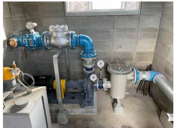
ろ過ポンプ（施工後）