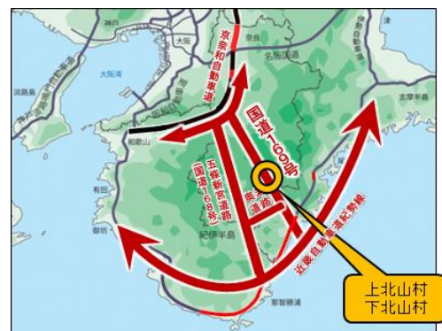
図－2 紀伊半島アンカールート

道路維持修繕事業の中で最も大きな割合（当初設計金額ベース）を占めるのが法面対策工事（42.7%）である。山間部の道路法面は大雨や台風等の自然災害に対して脆弱な箇所が多いため、災害発生後の地域生活・経済への影響をできるだけ少なくするための「減災対策」および災害の前兆現象の早期発見による「予防対策」に取り組んでいる。特に一般国道169号は、第一次緊急輸送道路に指定されているとともに、南部地域において、京奈和自動車道、一般国道168号と一体となり紀伊半島アンカールート（図－2）を構成する災害時に重要な役割を担う路線であり、奈良県中部の吉野町や橿原市、三重県熊野市や和歌山県新宮市へのアクセス道路として村民の生活においても重要な役割を担っていることから、道路の安全性向上が必須となる。