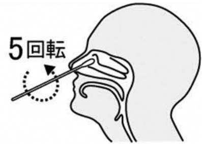
鼻腔ぬぐい液採取