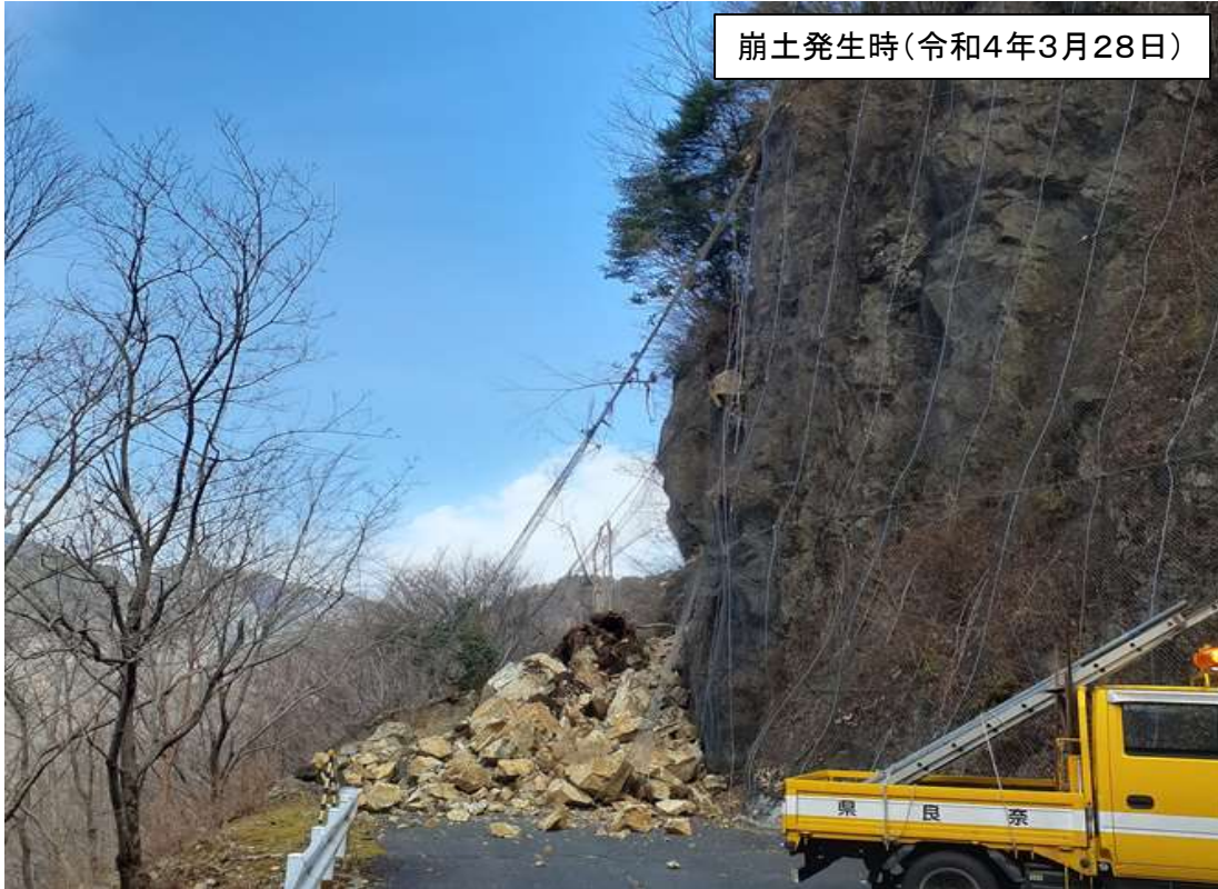
崩土発生時(令和4年3月28日)