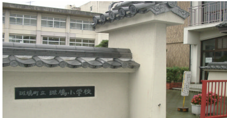
世界遺産を誇る町らしい斑鳩小学校の正門