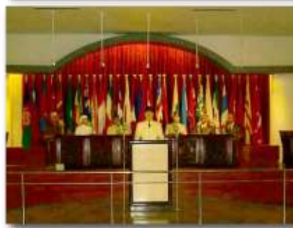
アジア・アフリカ会議博物館

1955年にアジア・アフリカ会議が行われた建物を利用した博物館です。会議には29カ国の代表が参加し、後の反植民地主義運動に影響を与えました。