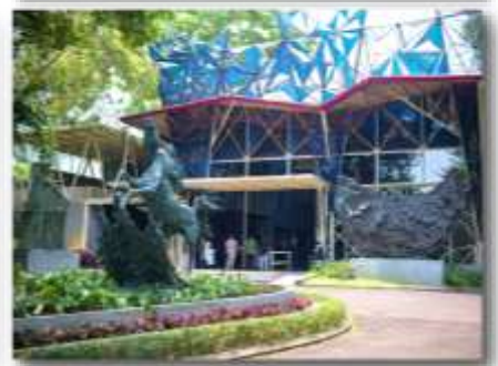
ヌ・アート彫刻公園

ヌ・アート彫刻公園では、主に彫刻家ニョマンヌアルタの作品が展示されています。美術館に加え、公園内でも多くの彫刻作品を鑑賞できます。