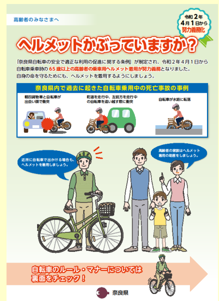
自転車条例チラシ（高齢者向け）

自転車を安心して利用するために、乗車時にはヘルメットの着用等の安全対策に努め、万一の場合に備えて必ず自転車保険へ加入しましょう。