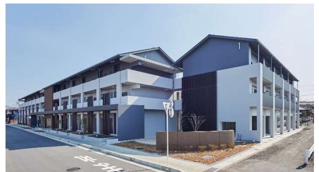
【第1期住棟完成写真 北西方向から撮影】