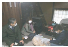
マーケティングの専門家派遣

南部農林振興事務所農業振興課 担当：担い手・農地マネジメント係 森本 農業次世代人材投資事業、農業経営者総合サポート事業、NARA 女性農業者育成事業、経営継承・発展等支援事業