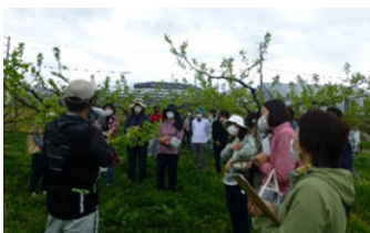
女性農業者対象セミナー