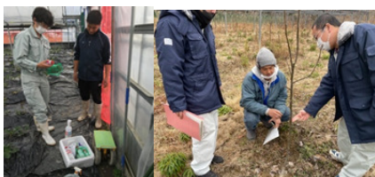
新規就農者巡回指導