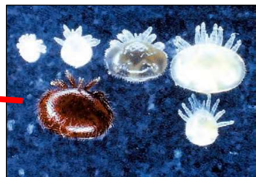
ミツバチヘギイタダニ