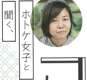
聞く、 ホトケ女子と