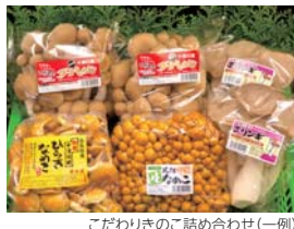
こだわりのご詰め合わせ(一例)

素朴ながらも豊かな自然が育んだ村自慢の優良特産品。お買い求めは下記HPから。村内の飲食店情報も掲載中。この機会に県南部東部の魅力をぜひご堪能ください!