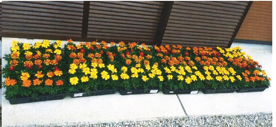
マリーゴールド苗