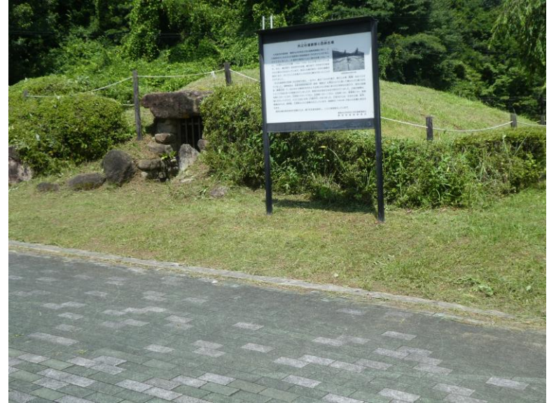
井ノ谷遺跡群と西峠古墳のある公園