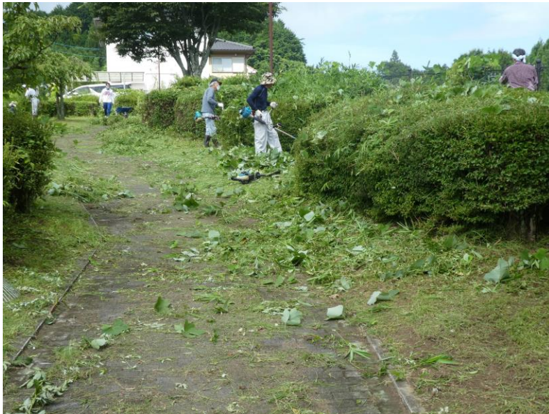
自治会員による草刈作業