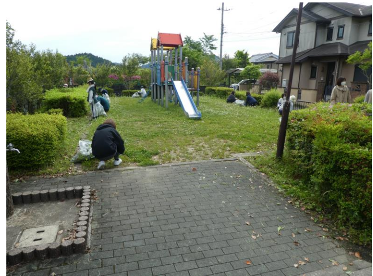
井ノ谷公園の草取り作業