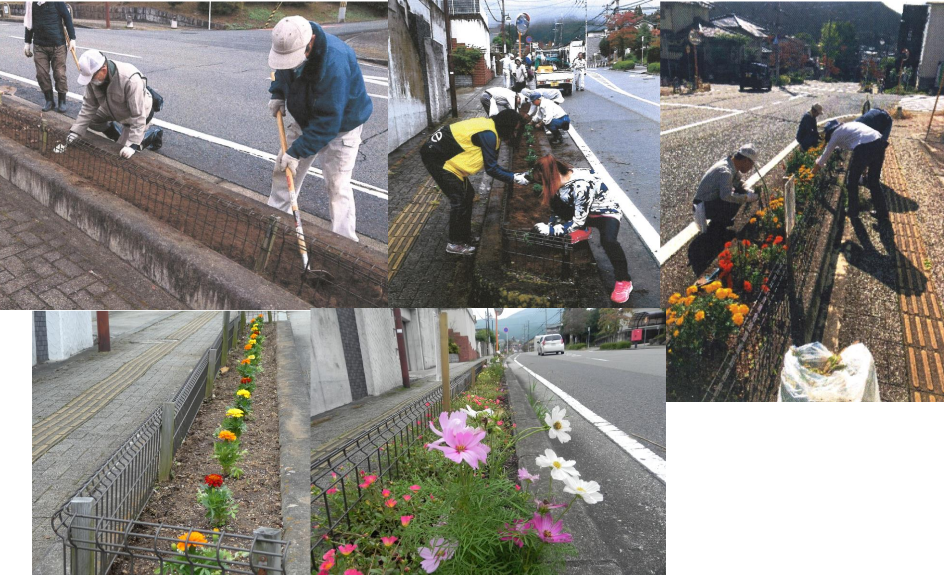
堆肥・腐葉土を混入し花壇整備後の植栽直後と満開時期