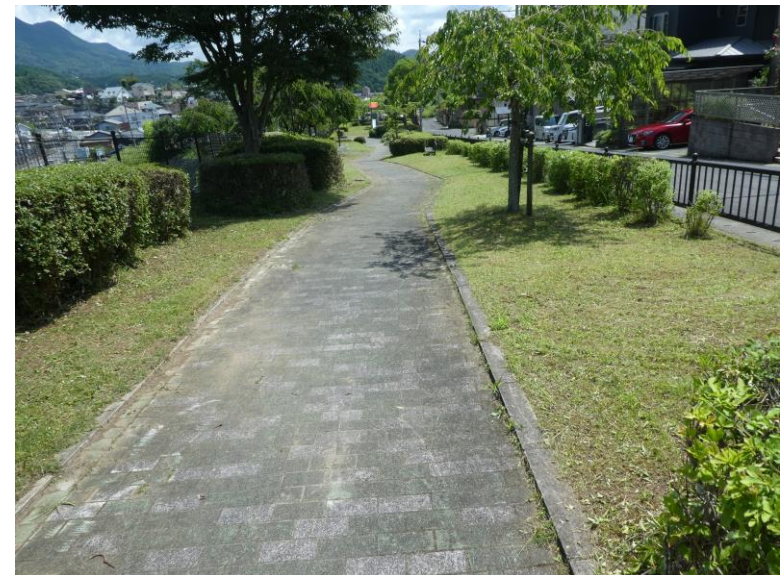
草刈後は清掃美化も実施