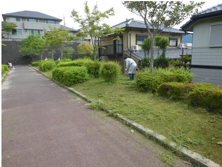
中央公園の草刈作業