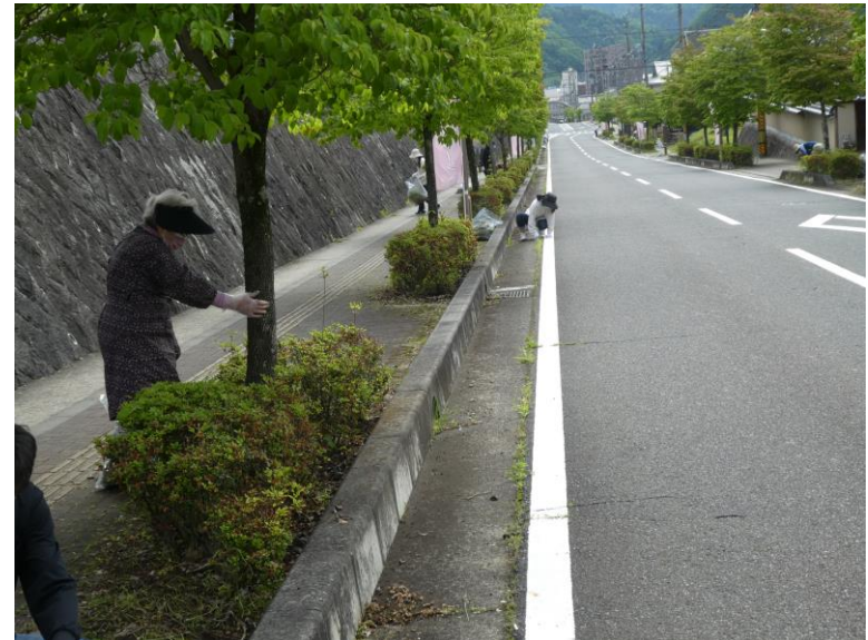
団地内の道路の草取り、剪定、清掃を実施