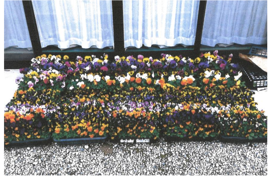
パンジー・ビオラ苗