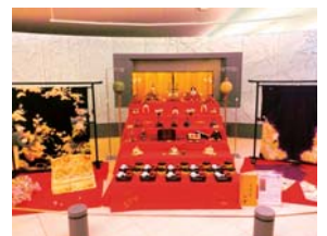
大正時代のおひなさま展示

※今後も四季にわたり『万葉集』に関するクイズラリーやコンサートのほか、国内最古の鑄造銭づくりが体験できる「富本銭をつくろう」や万葉衣裳の試着体験など、子どもから大人まで楽しめるイベントを開催します。お楽しみに!