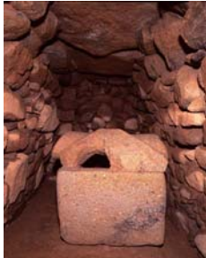
市尾墓山古墳横穴式石室と石棺

高取町では豪族が築いた前方後円墳や渡来系集団の奥津城とされる群集墳など、注目を集める古墳時代の遺跡が数多く見つかっています。本展覧会では、「豪族」と「渡来人」をテーマとし、古墳から出土したさまざまな品々を通じて国際色豊かで多彩な「高取の古墳文化」を紹介します。