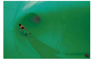
松井紫朗「あいちトリエンナーレ2010」より

■開村1周年記念 奈良ゆかりのアーティスト 交流プログラム vol.4 松井紫朗 「穴～時空をつなぐ回路」 3/21(祝)～4/23(日) 申込不要・無料(申込、料金が必要な会場あり) [会場]芸術文化体験棟、文化財修復・展示棟、 石上神宮、内山永久寺跡本堂池、 元興寺、長岳寺