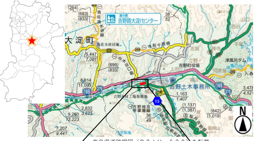
奈良県道路網図 (R3JHs632) を転載