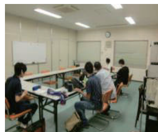
居場所風景:ゲームを楽しむ