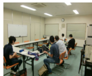
居場所風景:ゲームを楽しむ