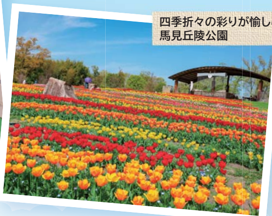
四季折々の彩りが愉しめる 馬見丘陵公園