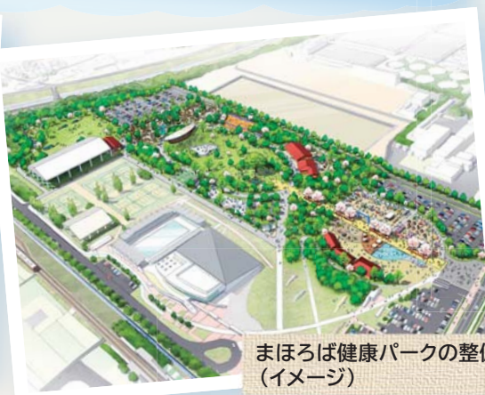
まほろば健康パークの整備 （イメージ）