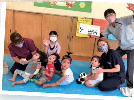
重症心身障害児者の生活支援