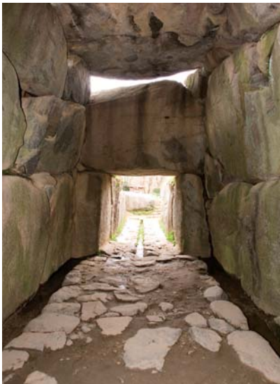
上:石舞台古墳(西から撮影) 下:石舞台古墳の石室内部(石室奥から入口へ)