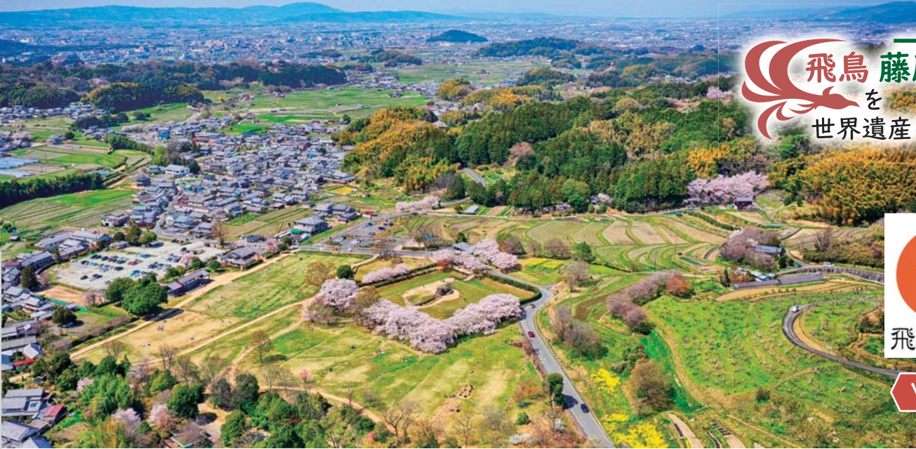
石舞台古墳(中央)。後方に飛鳥宮跡・藤原宮跡方面を望む(南東から撮影)