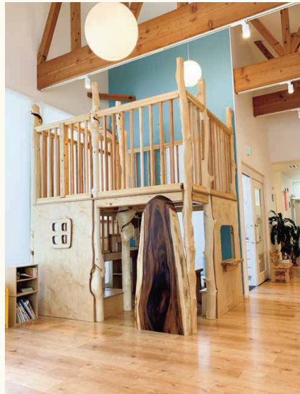
■歯科医院の待合室のスペースとして

伝統銘木は、床の間、和室、数寄屋建築等、日本の昔ながらの銘木類です。最近では洋風建築や商業建築など、いろいろな空間で楽しんでいます。