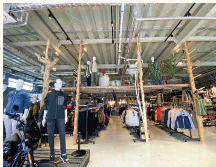
■店舗の商品ディスプレイに