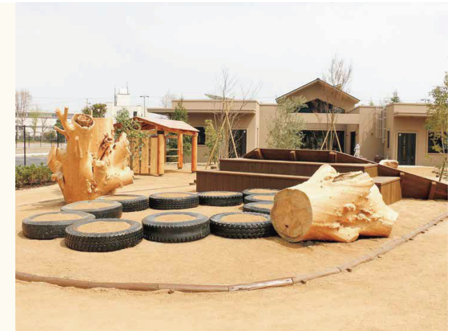
■自然木を活かした園庭