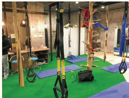
■介護施設のリハビリルームに