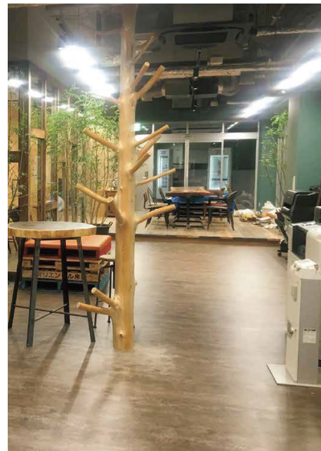
■オフィスの柱やテーブルに