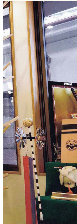
■自然木を活かした木登り棒