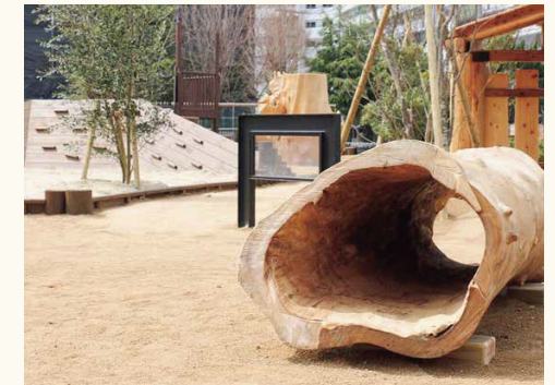
■自然木を活かしたトンネル

曲がり丸太はその特徴を活かし、手触りの良い手すりとして。樹齢200年を超える枝や、杉の皮も、アイデア次第で用途は限りなくあります。