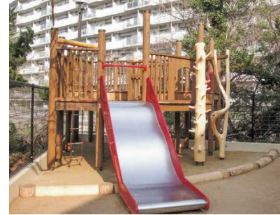
■園庭の木製遊具に

人間に個性があるように、木材にも個性があります。面白い杢目や個性的な特徴をを活かした製品創りが徳田銘木の得意とするところです。