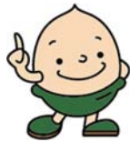
「緑の募金」 マスコットキャラクター どんぐりくん

4月1日～5月31日は「緑の募金春期強調期間」です。期間中は県内各地で「緑の募金」活動を行います。「緑の募金」は、森林整備や花の植栽への支援、みどりの少年団による緑化活動への助成、児童・生徒の緑化作品コンクールなどの普及啓発にも活用されます。自治会や職場での募金活動、街頭募金、緑の募金協賛自動販売機での商品購入などにより募金ができます。地域の豊かな緑を後世につなげていくためにも、ご協力をお願いします。