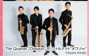
The Quartet "Oiseaux" ザ・クワルテット「オウゾー」