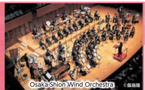
Osaka Shion Wind Orchestra