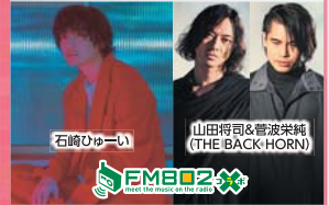
石崎ひろ一 山田将司&菅波栄純 (THE BACK HORNS)