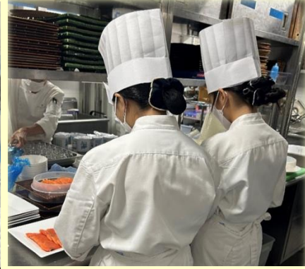
インターンシップ2023夏休み (JWマリオット)