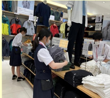
インターンシップ2023夏休み (ユニクロ)

キャリアセミナー では、 企業を訪問し、業界の事業内容 について学びます。 ※Web会議ツールを活用して実施する こともあります。