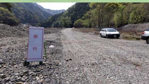
仮設道路写真 (4月18日撮影)