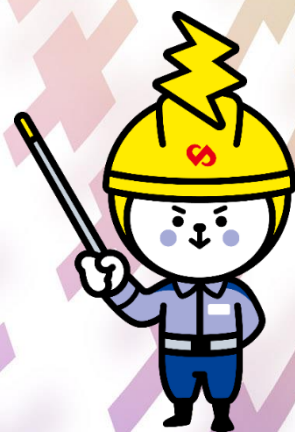
関西電力送配電 公式キャラクター おくりん