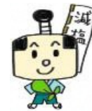
奈良県減塩キャラクターげんえもん

また、食の安全・安心確保に関する取り組みとして、食育推進リーダーに対する研修会や給食を提供する施設に対する研修会を実施します。