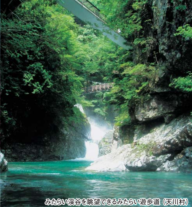
みたらい溪谷を眺望できるみたらい遊歩道（天川村）