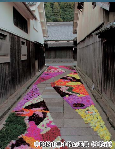
宇陀松山華小路の風景（宇陀市）