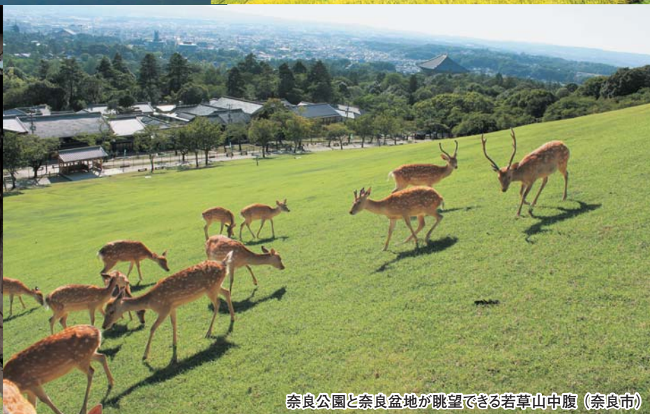
奈良公園と奈良盆地が眺望できる若草山中腹（奈良市）

奈良県には3つの世界遺産をはじめ、古墳や寺社、豊かな自然、歴史的な町並みなど、さまざまな景観が人々の暮らしの中にあります。