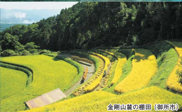
金剛山麓の棚田（御所市）