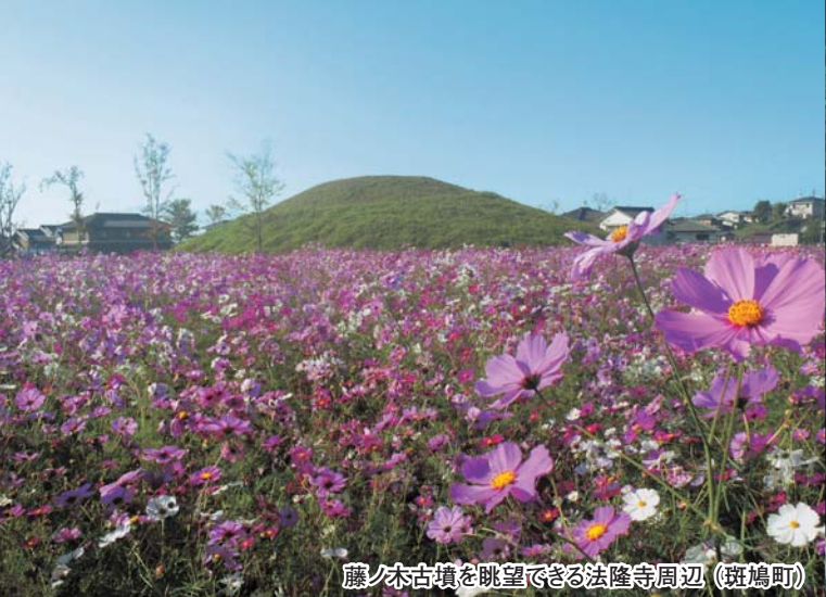
藤ノ木古墳を眺望できる法隆寺周辺（斑鳩町）